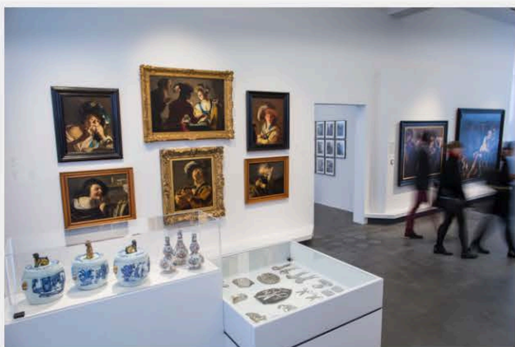
Collectie-opstelling Caravaggisten, © Ivar Pel Fotografie

En waar het museum tot voor kort een in zichzelf gekeerde stenen massa was, verankert het geraffineerde ontwerp van de verbouwingsarchitecten van Soda+ het complex via diverse doorkijkjes lichtig in zijn omgeving. Op een aantal plekken is de buitenwereld zichtbaar, met de tuin als stralend middelpunt.