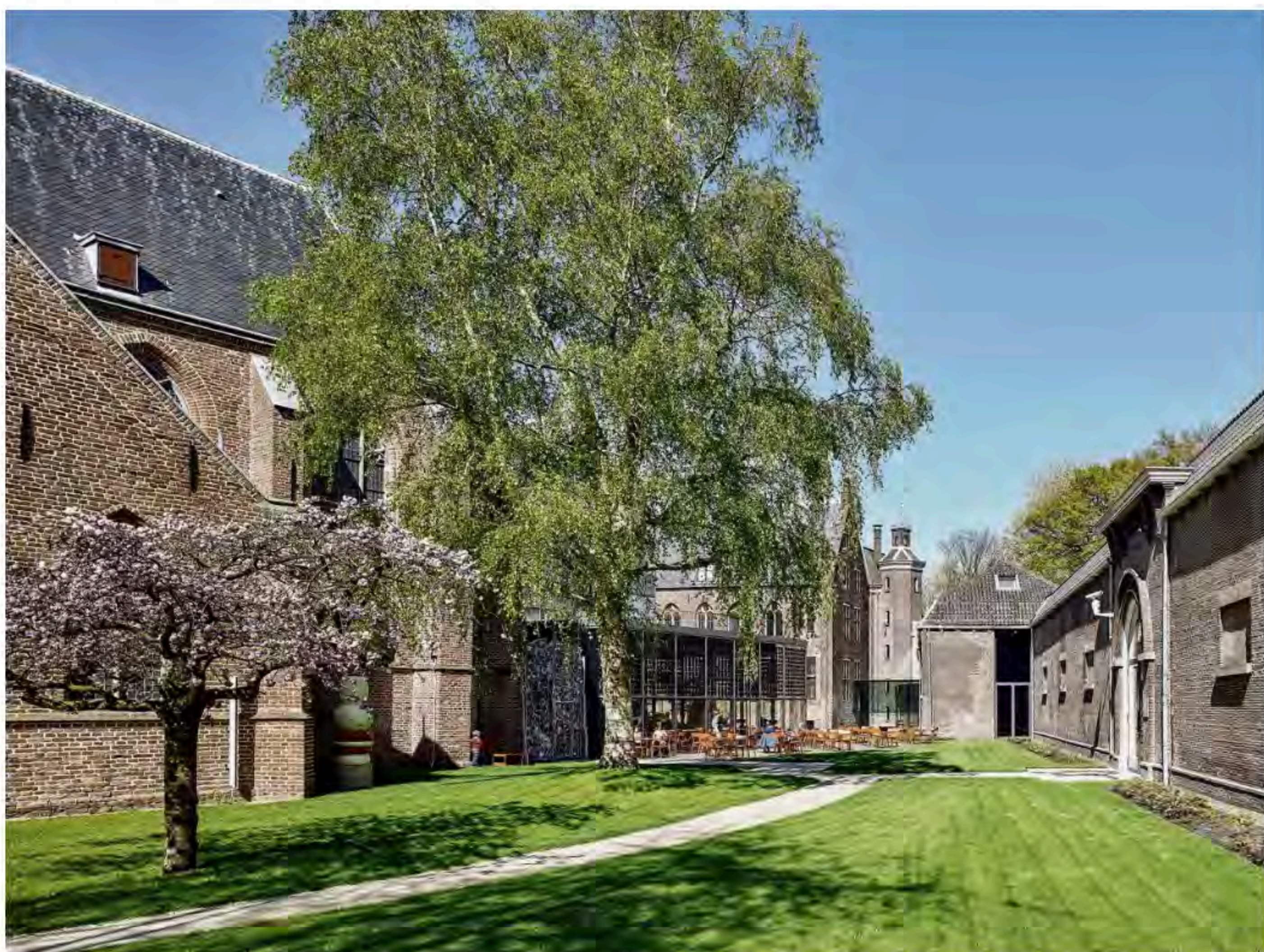
Binnentuin, ingang en loopbrug van het Centraal Museum.