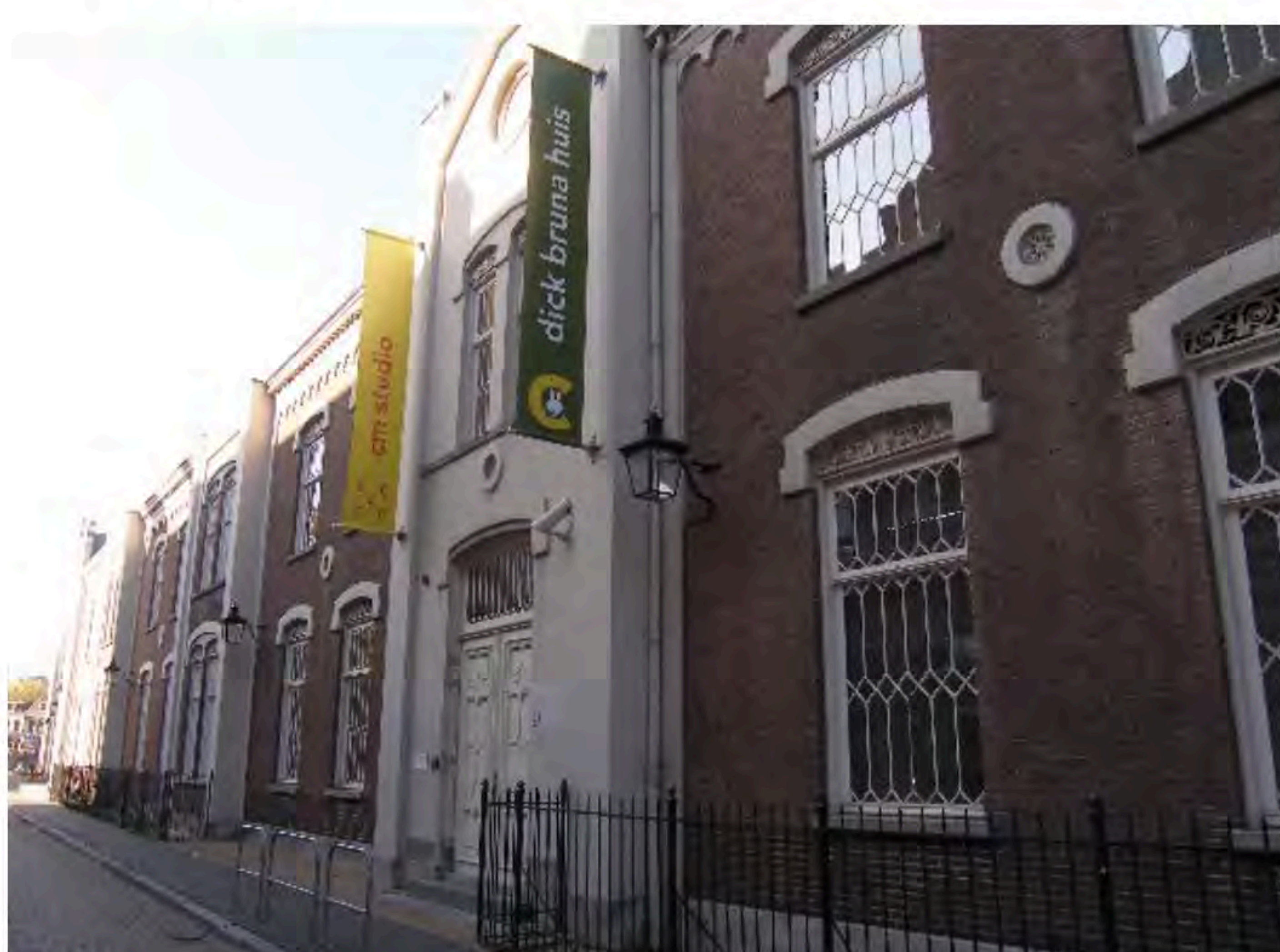
Entree van het dick bruna huis in Utrecht, tegenover het Centraal Museum.

Het huidige glazen entreegebouw wordt het nieuwe museumcafé dat ook toegankelijk is zonder entreebewijs en na sluitingstijd. Het café ligt aan de grote binnentuin, die als terras en openbare stadstuin wordt ingericht.