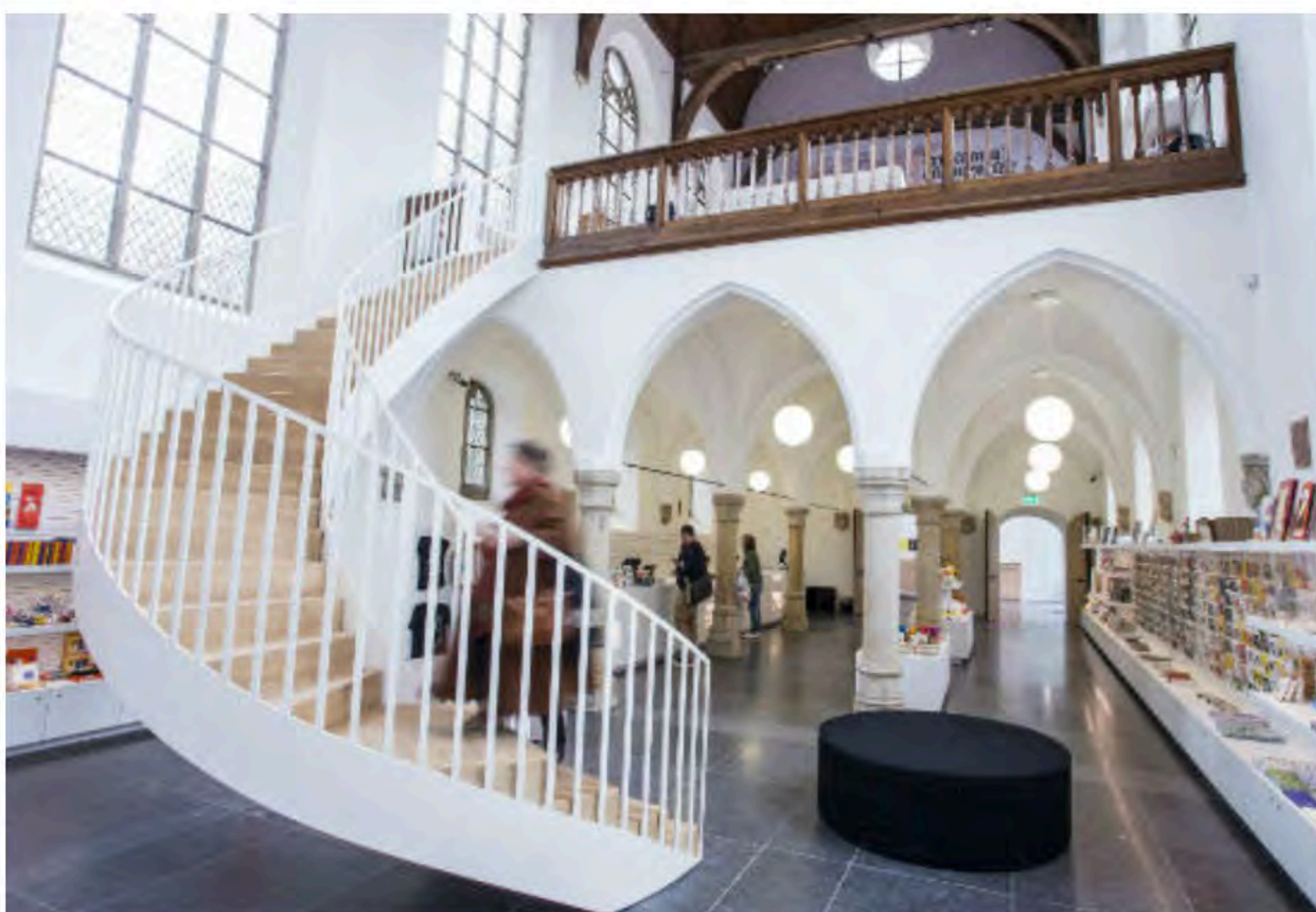
De nieuwe museumwinkel.

De vaste collectieopstelling De wereld van Utrecht heeft een internationale reikwijdte. De thema's gaan dwars door de wereld- en de kunstgeschiedenis heen. Alle disciplines in de collectie komen aan bod: moderne kunst, mode & kostuums, stadsgeschiedenis, oude kunst en toegepaste kunst.