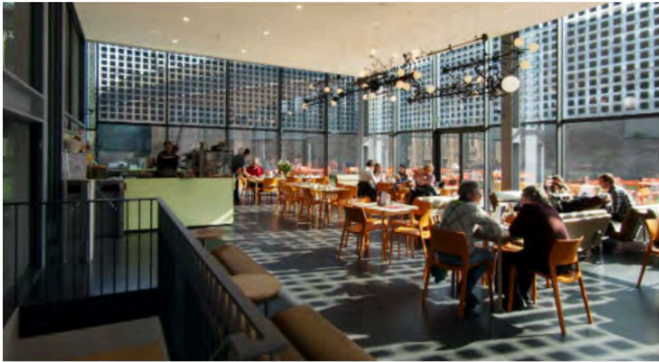
Het nieuwe café Centraal.