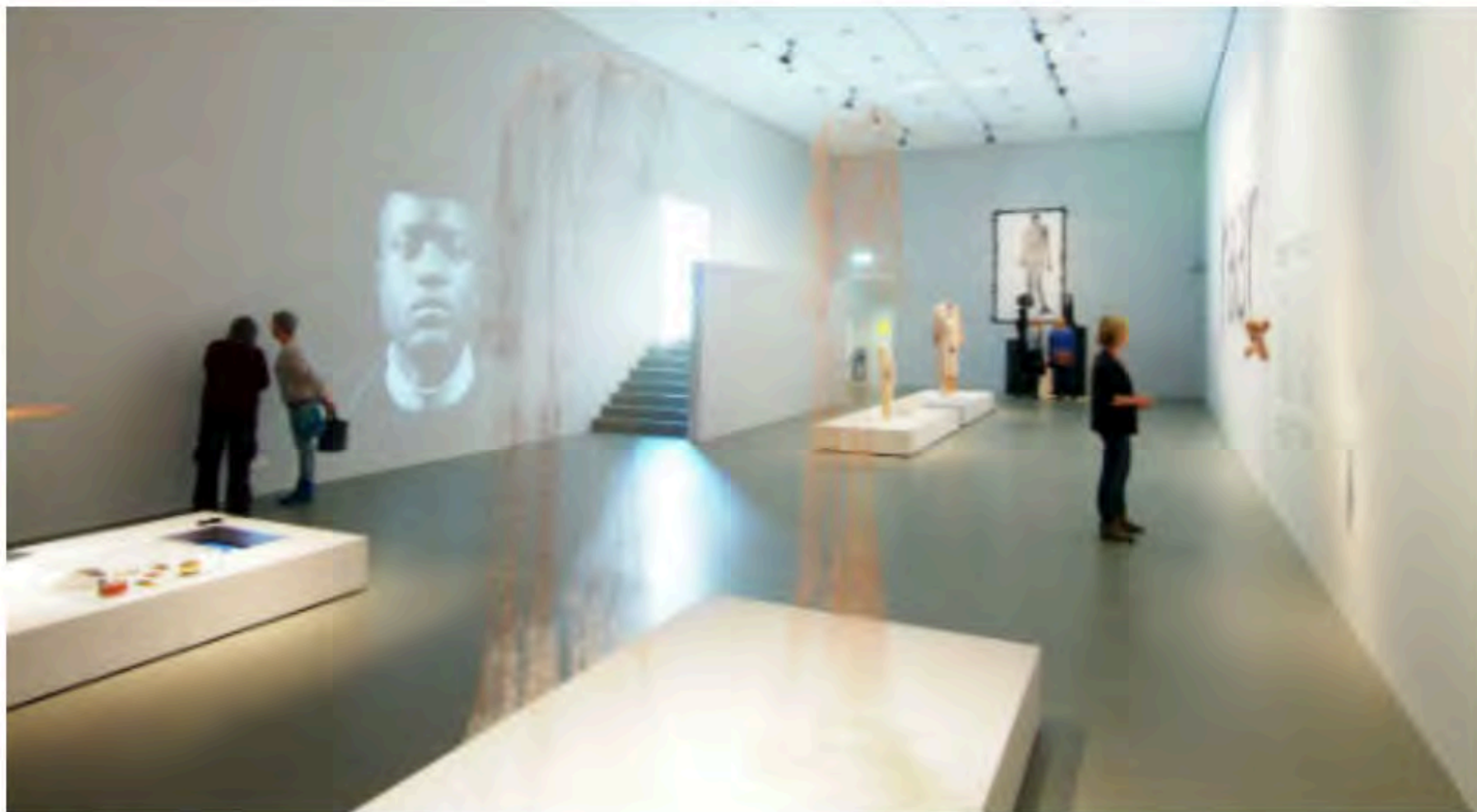
Museumzaal 'De Stallen'.