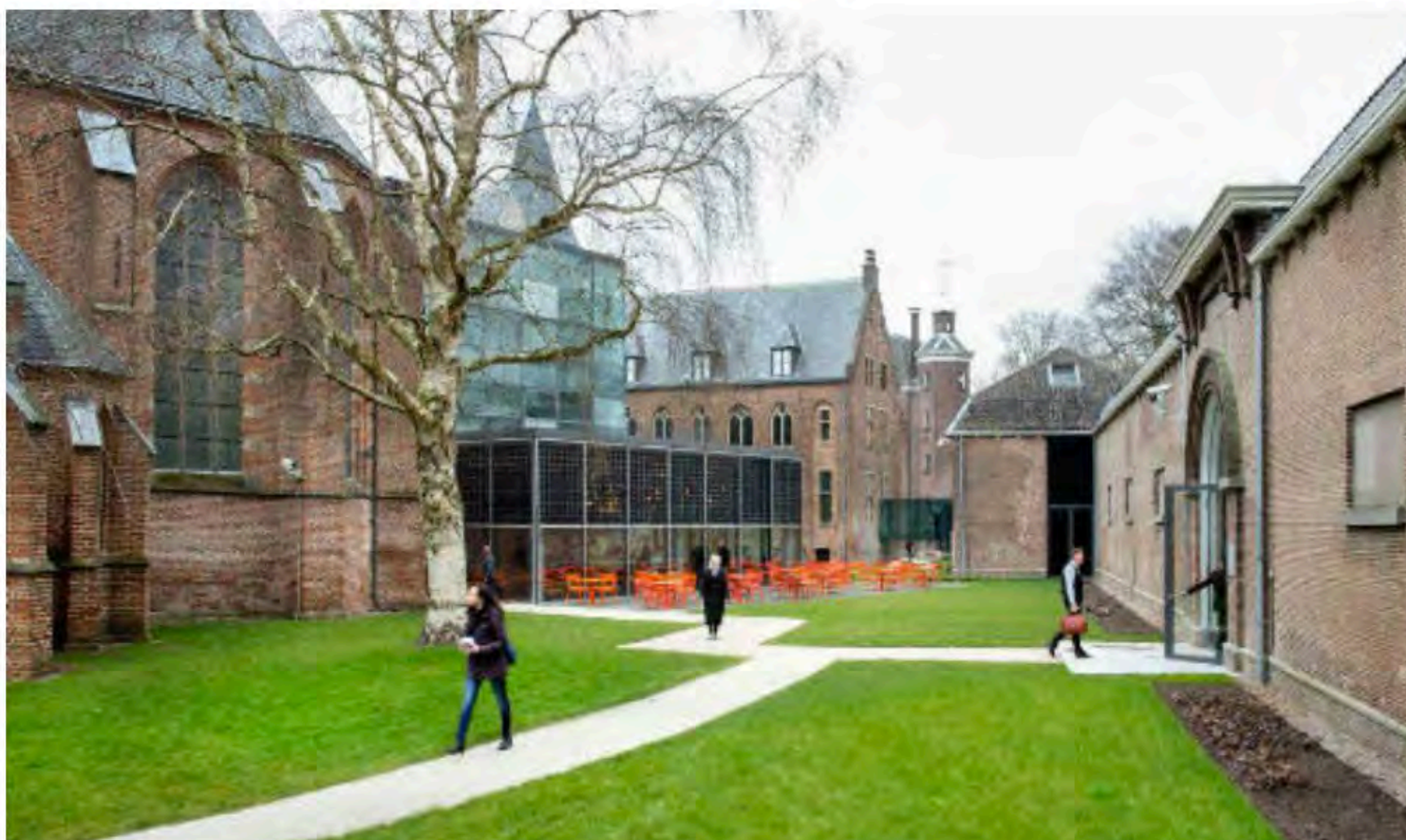
De nieuwe museumtuin.