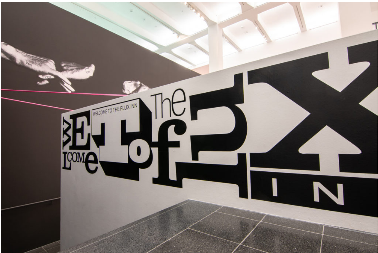
Interieurontwerp Body & Soul Dortmund U door SODA.

'BODY & SOUL. Denken, Fühlen. Zähneputzen' – Museum Ostwall in Dortmund U, Leonie Reygers Terasse, 44137 Dortmund. www.dortmunder-u.de . Openingstijden: di, za en zondag 11-18.00 uur, op donderdag en vrijdag van 11 tot 20.00 uur. Op maandag is het museum gesloten.