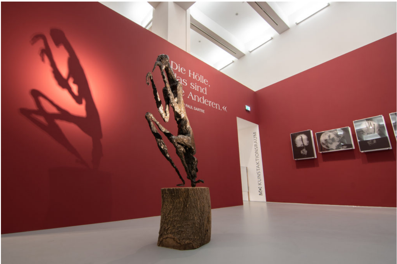
Interieurontwerp Body & Soul Dortmund U door SODA.

kleurenconcept met lichte en warmere kleuren, meubilair, rondingen, tapijten, kussens en zitzakken zorgen er voor dat je langer in de ruimtes wilt blijven.