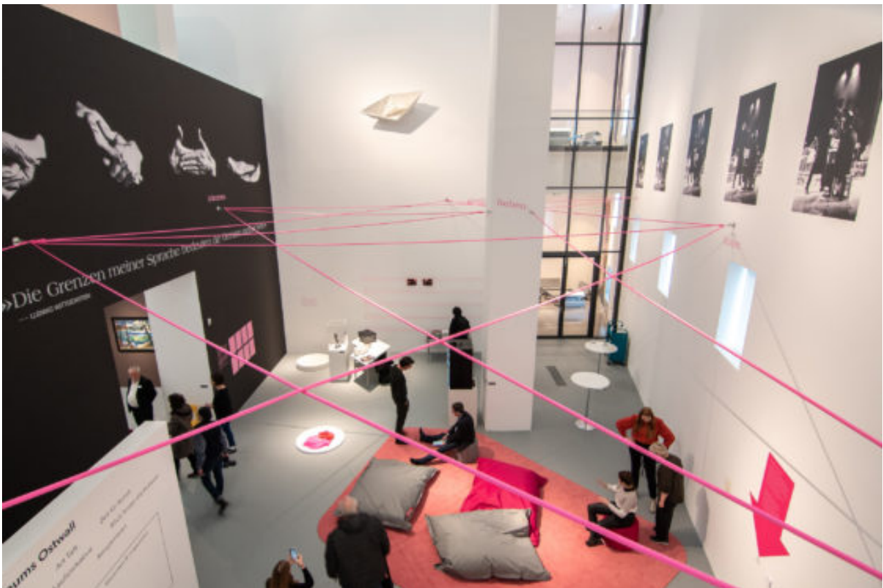
Interieur- en tentoonstellingsontwerp Body & Soul Dortmunder U door SODA.

Museum Ostwall is een museum voor moderne en hedendaagse kunst, gevestigd in de voormalige brouwerij Dortmunder U. Onlangs zijn twee museumetages na een verbouwing door het Nederlandse bureau SODA heropend. Het bureau ontwierp eveneens het tentoonstellingsontwerp van 'BODY & SOUL. Denken, Fühlen. Zähneputzen'.