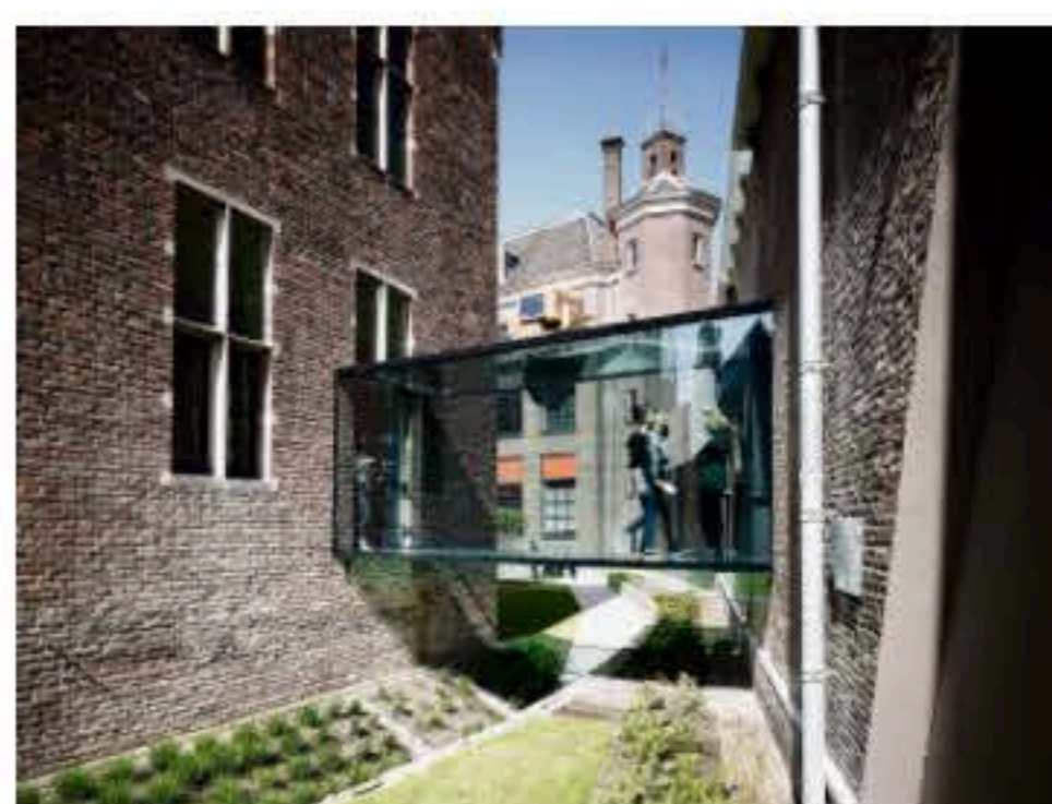
Ingang, binnentuin en loopbrug van het Centraal Museum.

Het nieuwe Centraal Museum is, na een exclusief openingsfeest vanavond, het komende weekeinde (23 en 24 april) gratis toegankelijk. Dan kan het publiek voor het eerst de nieuwe vaste opstelling zien van de museumcollectie.