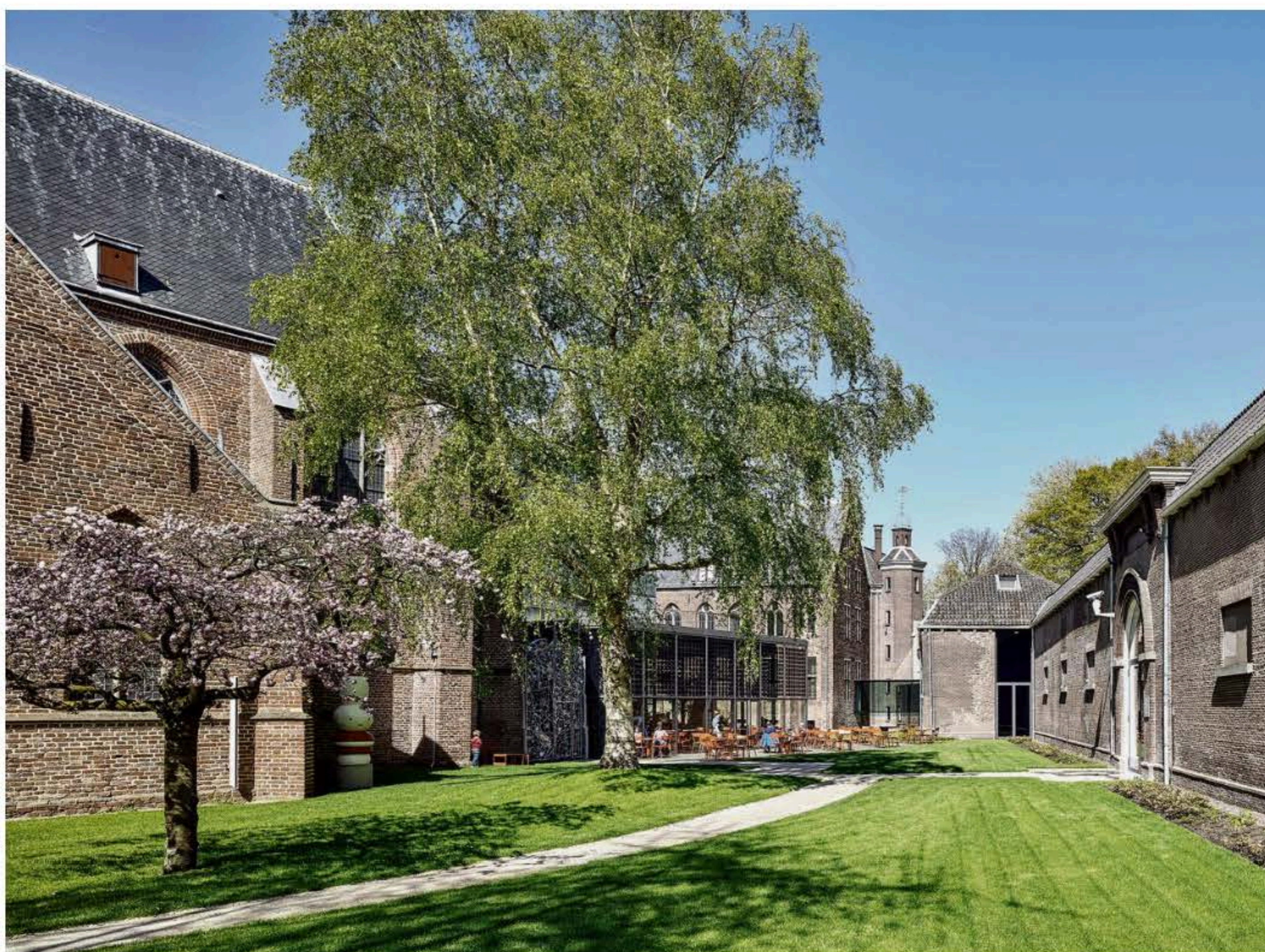
Binnentuin, ingang en loopbrug van het Centraal Museum.